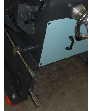
メッシュ開閉機構