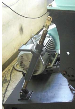
ホッパー開閉機構